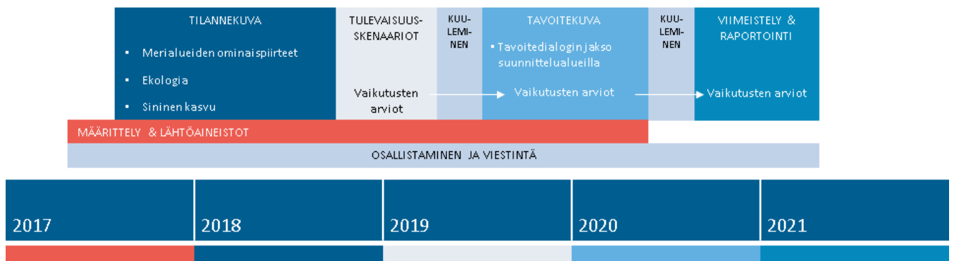
Kuva 3. Merialuesuunnittelun aikataulu.

Ympäristöministeriö ja maakuntien liitot järjestävät säännöllisesti merialuesuunnittelun ajankohtaistilaisuuksia, joissa esitellään suunnittelun etenemistä merialuesuunnittelun yhteistyöryhmälle. Yhteistyöryhmään voi ilmoittautua osoitteessa https://www.kyselynetti.com/s/merialuesuunnittelu .