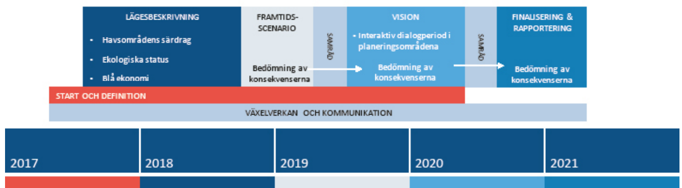
Bild 3. Tidtabell för havsplaneringen.

Miljöministeriet och landskapsförbunden ordnar regelbundet möten om det aktuella läget inom havsplaneringen där de presenterar hur planeringen går framåt för samarbetsgruppen för havsplanering. Man kan anmäla sig till samarbetsgruppen på https://www.kyselynetti.com/s/merialuesuunnittelu .